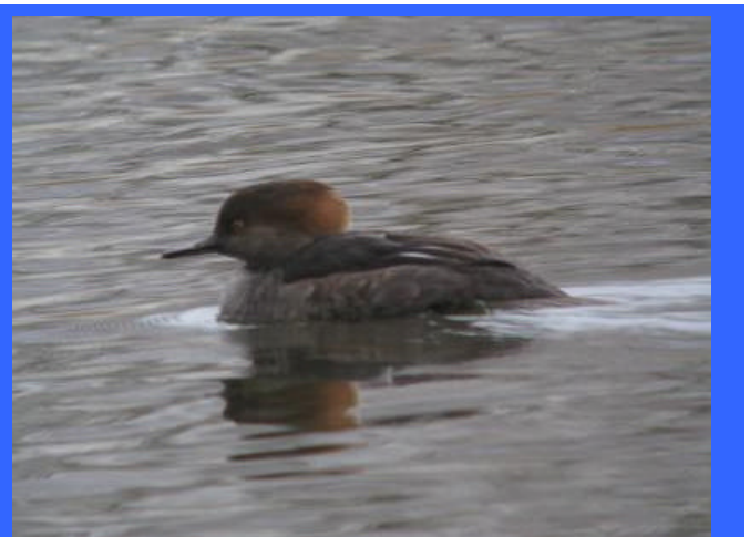
Mannetje Kokardezaagbek broekbos 2007

Geeft het door aan kennissen en vrienden. Er is nog plaats!