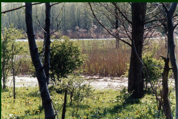
Diversiteit in vegetatie trekt vogels aan N.v.d. Berg-Engering- Stille kern

Gezien de vogelrijkdom is het Horsterwold voor de vogelaar een paradijs.