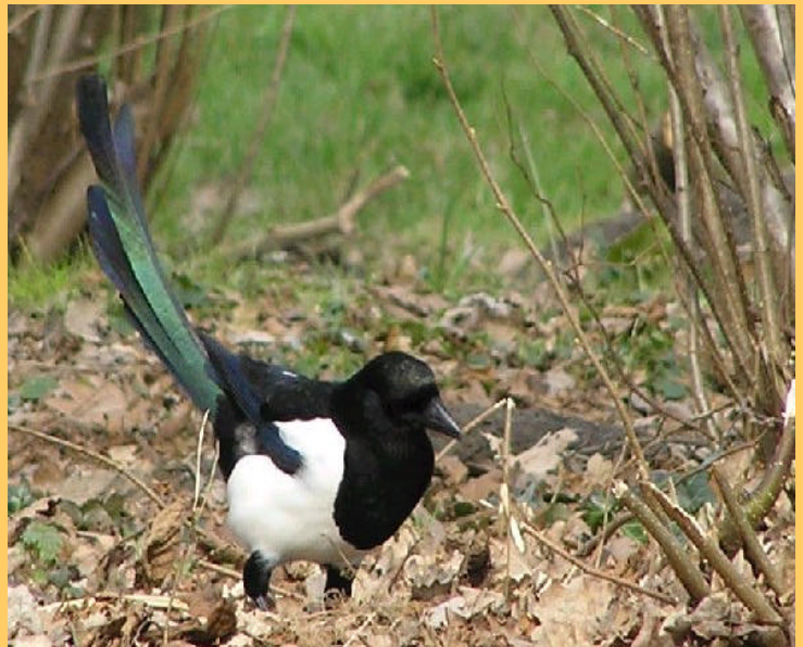
Man Ekster Elzenlaan - R.v. Swieten

Wie dus een slaapplaats denkt te hebben waargenomen geef het dan door aan de coördinator. Behalve eksters is ook een verzamel(slaap)plaats van kauwen in de omgeving van de Sphinx geteld. Dit waren 42 exemplaren. De eerste kauw diende zich in Zeewolde aan, als broedgeval, in 1994.