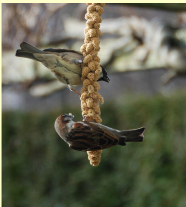
Foeragerende huismussen