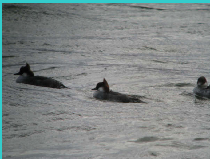
Vrouw Nonnetjes op randmeer/W.Hoogenhuizen 2008

Een andere soort die ook die ook in de winter te zien is, is het Nonnetje. De aantallen van deze soort liggen beduidend minder hoog met resp. nov 2007, dec. -, jan 2008, 13, 26 en 6 exemplaren. Met dank aan alle tellers van de watervogeltellingen Wolderwijd.