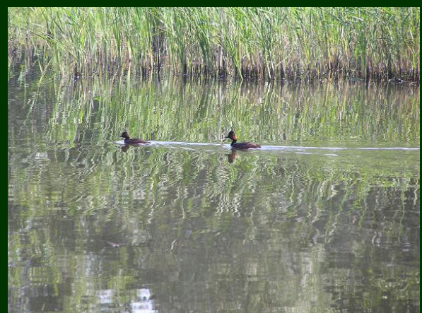
Geoorde Fuut als nieuwe broedvogel sinds 1998 in de Stille Kern/Horsterwold R.v.Swieten -Gelderse Slenk