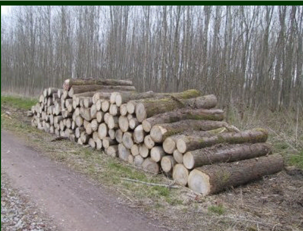
Horsterwold als productiebos. R.v.Swieten - Horsterwold

De Nieuwsbrief is een uitgave van de Vogelwerkgroep Oriolus IVN Zeewolde Website: www.vwgoriolus.nl Contact: r.v.swieten2@chello.nl